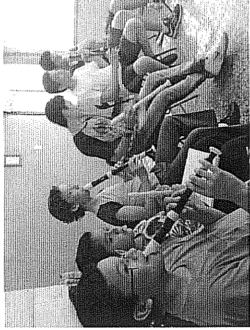
Estudio de ligaduras con blancas Actividad realizada el 08 de mayo de 2018