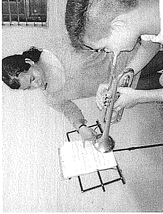
Lectura musical fase IV Actividad realizada el 03 de mayo de 2018