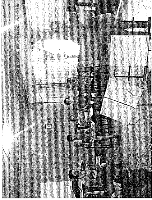
Estudio de ligaduras con corcheas Actividad realizada el 10 de mayo de 2018