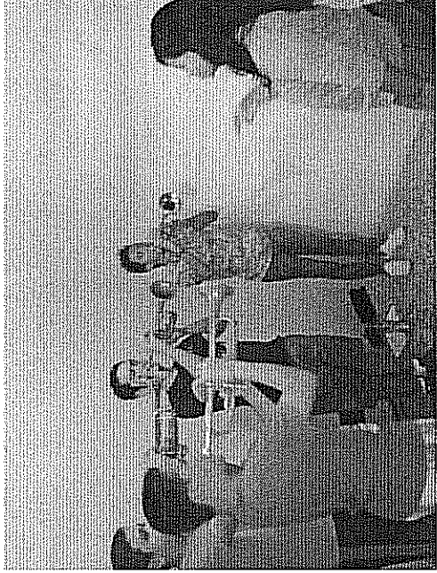
Estudio de ligaduras con negras Actividad realizada el 09 de mayo de 2018